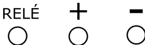
Obrázek 3 - Konektory Bezbateriové Jawy